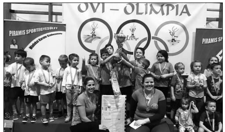
Győztes csapatunk a városi Ovi-Olimpián