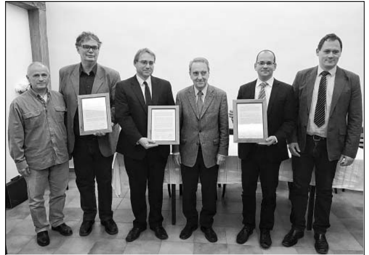
A szentendrei református, evangélikus és baptista gyülekezet képviselői közös nyilatkozatot írtak alá

Céljuk, hogy a reformáció ünnepén a társadalmi és vallási kérdésekben megosztott, a keresztyén hit igazságában megrendült Európában, nemzetünk, közösségeink, családjaink megmaradására megerősítsék elköteleződésüket