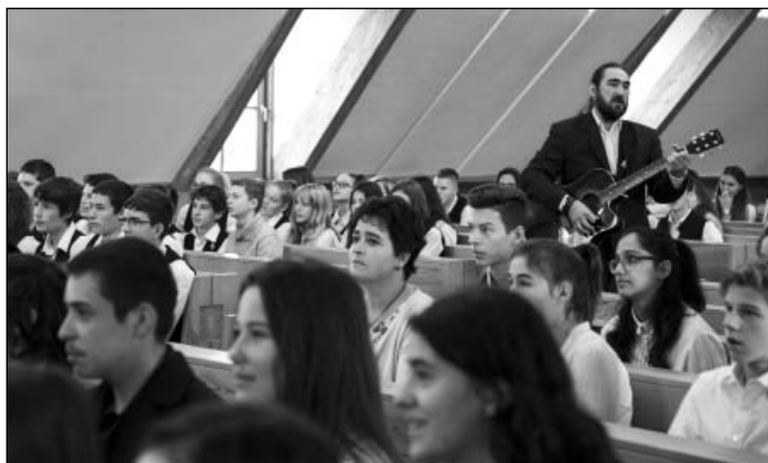
Zenés áhítat a versenysorozat záróünnepén

Hosszú szervezőmunka és minden téren alapos felkészülés kell hogy megelőzzön nagy eseményeket. A reformáció 500. jubileumi éve nagy esemény. Nemcsak megemlékezés, annál sokkal több: a több mint félezer évvel korábban kezdődő szellemi, lelki megújulás felelevenítése, ébren tartása és a mindennapokban való megélése. Feladatunk nem kevesebb, mint megismertetni, élővé tenni a mai fiatalok életében is a reformáció páratlan hagyatékát.