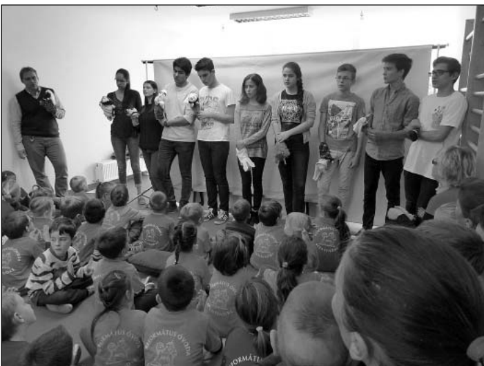
Az ifisek idén is színvonalas előadással érkeztek

Másnap, október 7-én, szombaton tartottuk a szokásos Családi napunkat az óvodában, ahol lelkipásztorunk áhítata után a gyülekezet ifisei bibliai témájú bábelőadásukkal szórakoztatták az óvodásokat. Mindenki megtalálta a számára legkedvesebb elfoglaltságot: népi játékok és kosár-körhinta az udvaron, kézműveskedés a csoportszobákban, a felnőtteknek bibliakör.