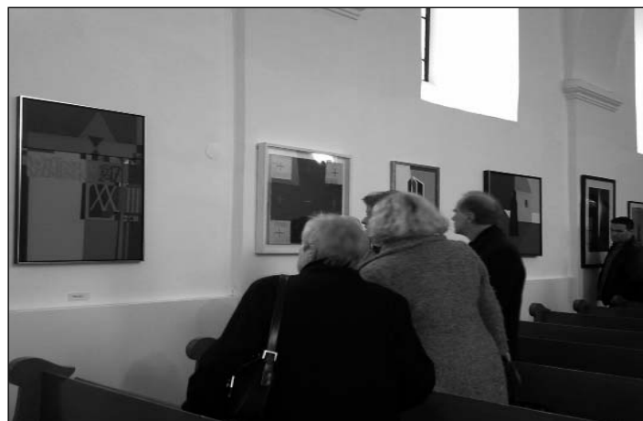
Harminchét művésztől érkezett alkotás a közös kiállításra