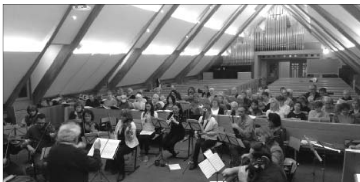
A kantátaest főpróbája a Református Gimnázium kápolnájában