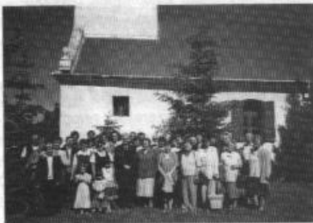
A kirándulás résztvevőinek csoportja

Egyházközségünk több évtizede patronálja a maroknyi etyeki református-ságot, amely évenkénti anyagi támogatásból és kölcsönös alkalmasszerű látogatásból áll.