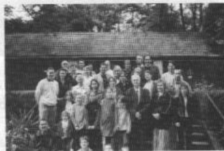
A hétvége résztvevőinek csoportja

"Együtt" összefoglaló címmel szeptember 16-18-án gyülekezeti hétvégét tartottunk Tahi Sion-hegyen. A sok virággal díszes, a nyár után már elcsöndesedett üdülőben mintegy negyvenen voltunk gyülekezetünkbeli a legkülönbözőbb korosztályokból.