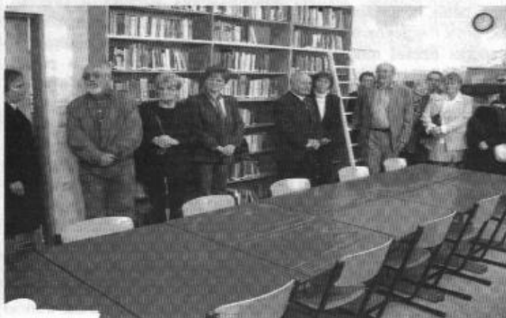
Az új olvasóteremben

Alig több mint egy hónapja járunk iskolába, és már zajlik körülöttünk az élet. A tanévnyitó előtt gólyáink - az 5. a, a nyelvi előkészítő osztály és a 9. a. osztály - Tahiban, a Sion-hegyen táboroztak. Gólyáink minden évben itt töltik a nyári szünet utolsó napjait, így van idejük és lehetőségük, hogy megismerjék egymást és osztályfőnöküket, halljanak az iskolánkról, a tanárokról. Szép hagyománnyá vált, hogy a táborban "öreg diákjaink" egyengetik gólyáink "első lépéseit".