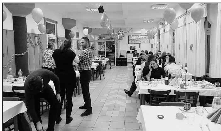
Meghitt beszélgetések helyszíne is lehet ilyen alkalmakkor az Áprily terem

A bál este 7 órakor kezdődött, és szépen gyülekeztek a vendégek. Ez idő alatt megtekinthetők voltak az este folyamán árverezésre kerülő tárgyak és a tombola nyereményei.