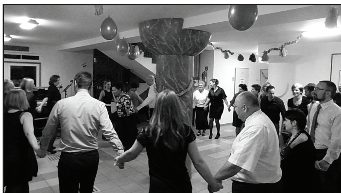
Össztánc az óvodai bálon