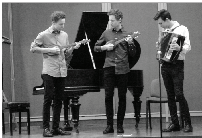
Újrakezdési koncert a gimnázium kápolnájában