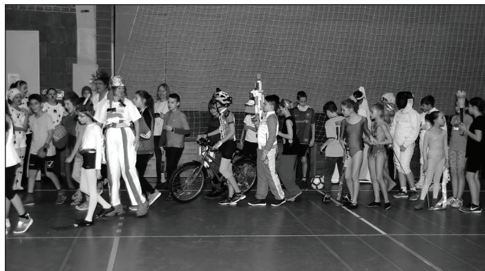
Farsangi felvonulás a tornacsarnokban

A farsangi ünnepségünk az idei tanévben is színes kavalkád volt. A diákok az álarcos felvonulás mellett sok nagyszerű programon vehettek részt, amelyet hagyományosan most is a 7. évfolyamosok szerveztek meg, a program lebonyolításában pedig a tanárok nagy segítségét nyújtottak.