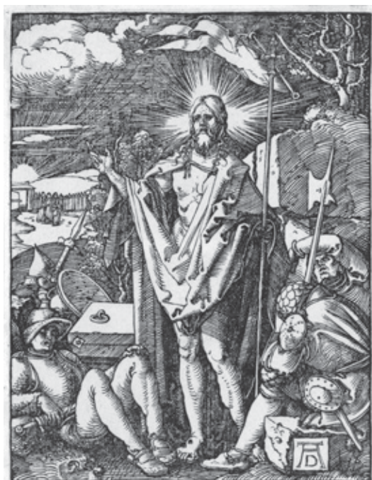
Albrecht Dürer: Feltámadás (1509 körül, fametszet, papír, Szlovák Nemzeti Galéria)