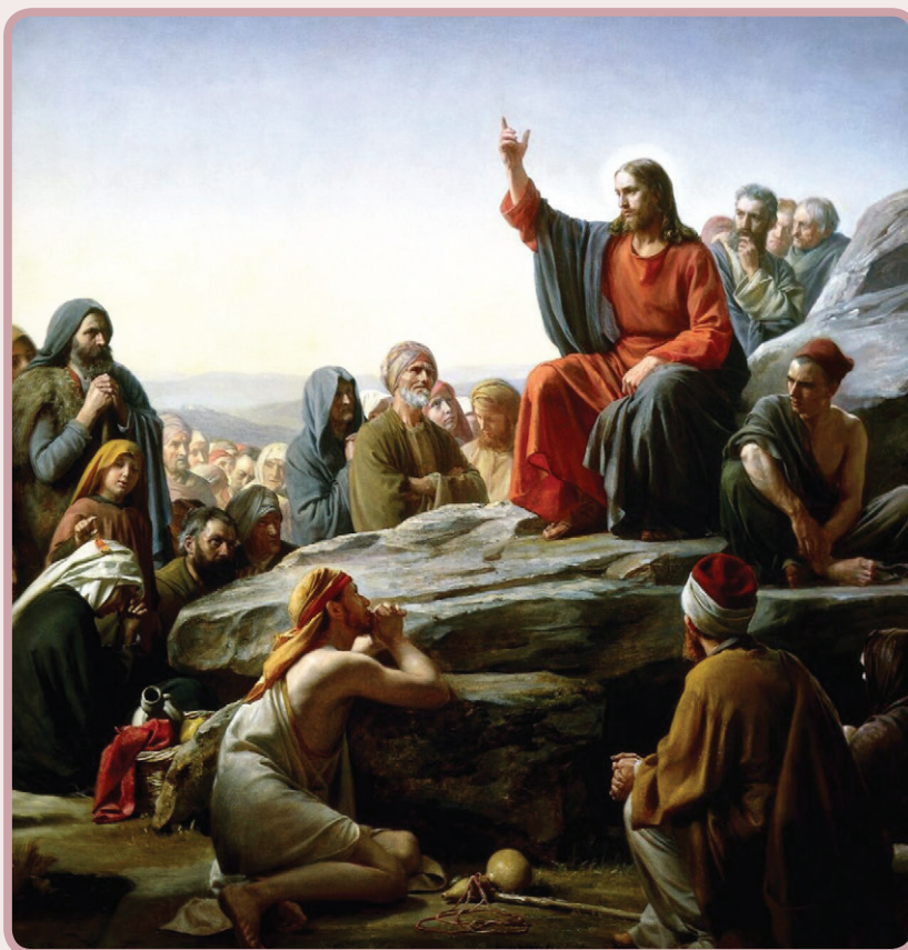
Carl Heinrich Bloch (1834–1890): A hegyi beszéd , 1877

Nyilvánvalóan összefügg az emberekkel a koruk. Kölcsönhatás ez. Jézus Lelke, a Szentlélek új embereket teremt, vagyis újjáteremti az embereket, bennünket. Az új emberek pedig formálják, alakítják korukat. A szentség – ha az összekapcsolódás, ha az imádat, azaz ön-