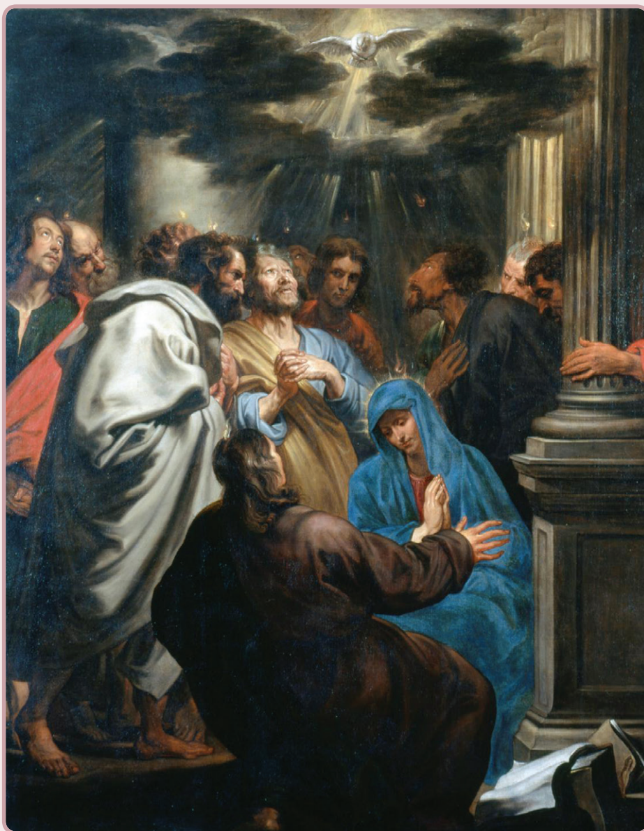
Anthony Van Dyck (1599-1641): A Szentlélek eljövetele (Pünkösöd) , kb. 1618-1620

Nem pusztán életünk eseményeit szemléljük, miként változnak imakéréseink vagy bűnbánatunk hatására, hanem maga az imádság az, ami történik: a Szentlélek Istennel való egység és a találkozás pillanata.